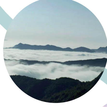
韓東籠雲（豐順縣） （作者：劉淺萍）