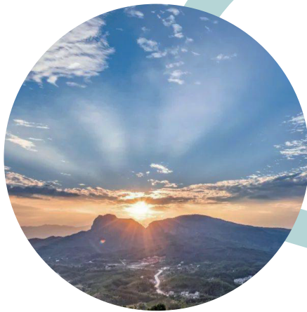
卧佛含丹（平遠縣） （作者：林莊）