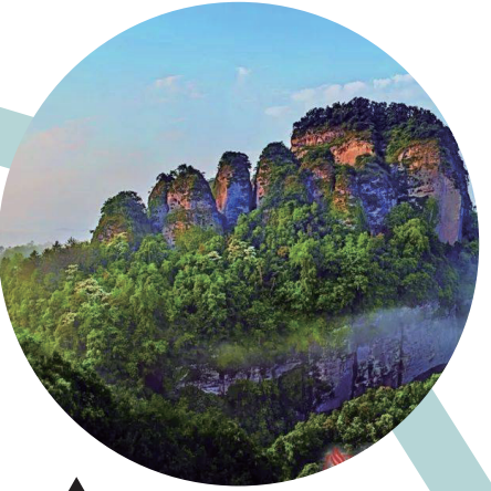
五指擎天（平遠縣） （作者：舒劍）