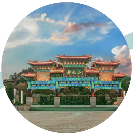
神光普照（興寧市） （作者：陳燕山）