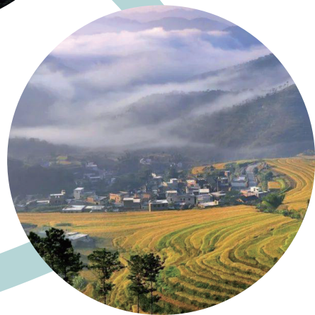
坪山梯田（大埔縣） （作者：李根源）