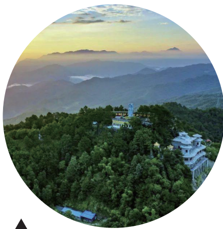
清涼春色（梅江區） （作者：高凱）

州十四大名人故（舊、祖）居”。近年來，隨着我市經濟社會的發展和文化旅游資源開發保護力度的不斷加大，一批凝聚着梅州濃厚歷史感和文化特色的老景觀重新煥發生機，一批充滿濃厚時代氣息、承載梅州美好未來的現代新景觀相繼湧現，成為展示梅州現代美和城市文明的新標志。市委組織部、市委宣傳部、市委黨史研究室、市文化廣電旅游局、梅州日報社、市廣播電視臺等單位組織開展了“梅州十景”“梅州紅十景”“梅州文十景”“梅州十四大名人故（舊、祖）居”評選活動。經過廣泛徵集、初步評選、網絡投票、專家評審、集體研究，並報市委、市政府審定和公示，最終產生“梅州十景”系列結果。