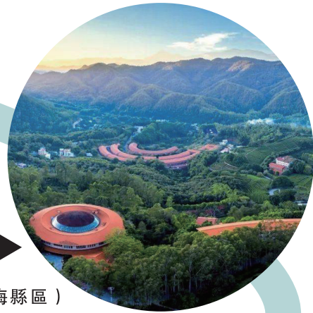
雁南茶韻（梅縣區） （作者：王浩）