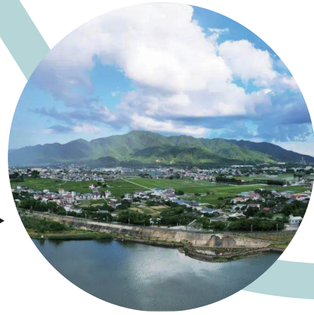
石窟畫廊（蕉嶺縣） （作者：汪敬森）